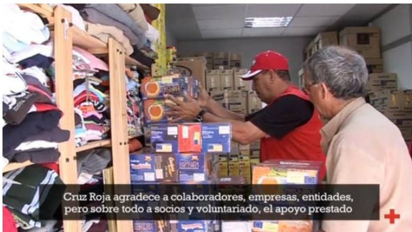
Cruz Roja agradece a colaboradores, empresas, entidades, pero sobre todo a socios y voluntariado, el apoyo prestado

A través del citado Plan se está redoblando el trabajo de intermediación con el tejido empresarial y la formación en aquellos sectores que siguen teniendo demanda o que tienen potencial de crecimiento, promoviendo además el asesoramiento a emprendedores para que constituyan su propio puesto de trabajo con microempresas o bien que consoliden el que ya tienen. Y además se está fortaleciendo la generación de espacios de ayuda mutua entre las propias personas desempleadas, sumando esfuerzos con las empresas a través de la responsabilidad social empresarial. En este sentido, podemos destacar que durante 2012 más de 8.600 personas en dificultad social accedieron a un trabajo (de ellas, 5.730 fueron mujeres); 20.800 personas mejoraron sus competencias para el acceso al empleo a través de alguna de las 8.900 acciones formativas realizadas; y unas 7.000 empresas colaboraron con Cruz Roja a través de ofertas de empleo, prácticas no laborales, información sobre el mercado de trabajo, asesoramiento empresarial, etc.