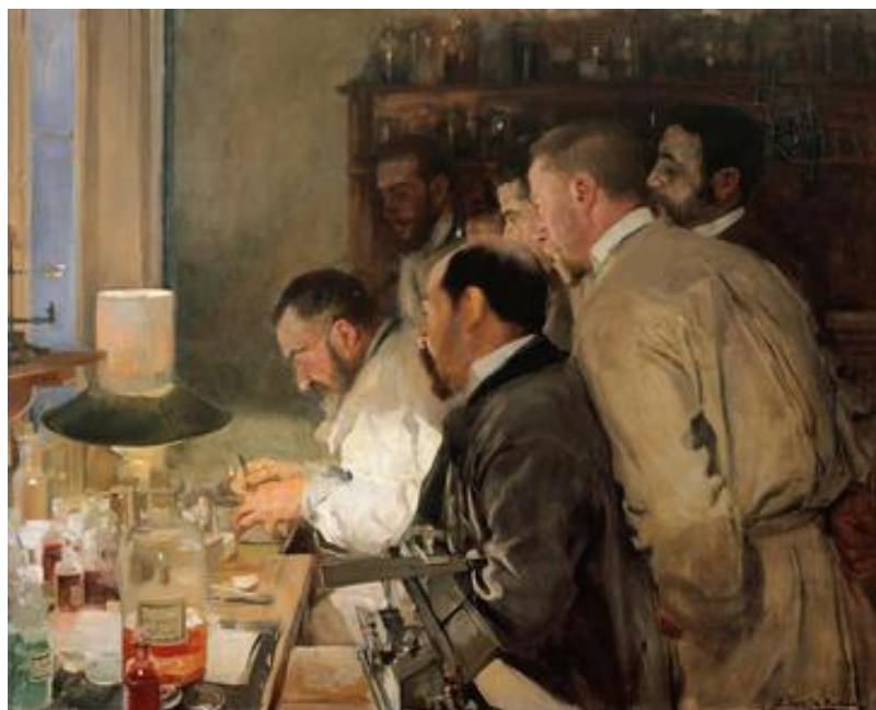
'Una investigación', del pintor Joaquín Sorolla (Museo Sorolla).

El mayor motor de búsqueda de internet ha logrado seducir a una treintena de museos e instituciones españolas para que 'cuelguen' sus obras de arte en Google Art Project, según ha informado hoy la empresa durante una presentación celebrada en Madrid. La iniciativa del gigante californiano permite visitar on line los principales museos mundiales y ver las imágenes de sus cuadros digitalizadas con una resolución de hasta 7.000 millones de píxeles en las obras más destacadas.