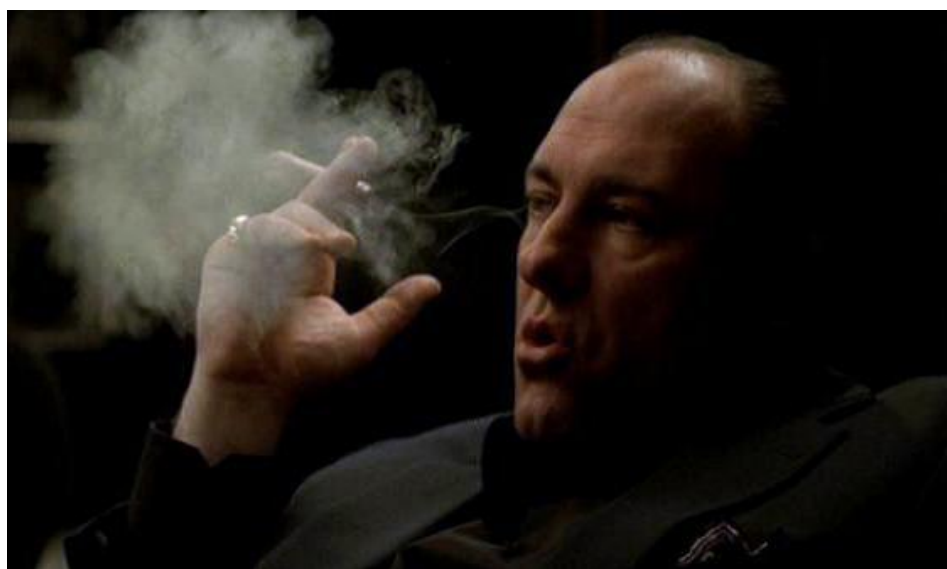
James Gandolfini es “Tony Soprano”

En ocasiones una situación planteada en la literatura o el cine provoca una respuesta emocional contraria a la que se esperaría en la vida real. O, dicho de otra manera, si nos topáramos con Tony Soprano, el gánster interpretado por el hoy fallecido James Gandolfini , no nos haría tanta gracia como en la pantalla.